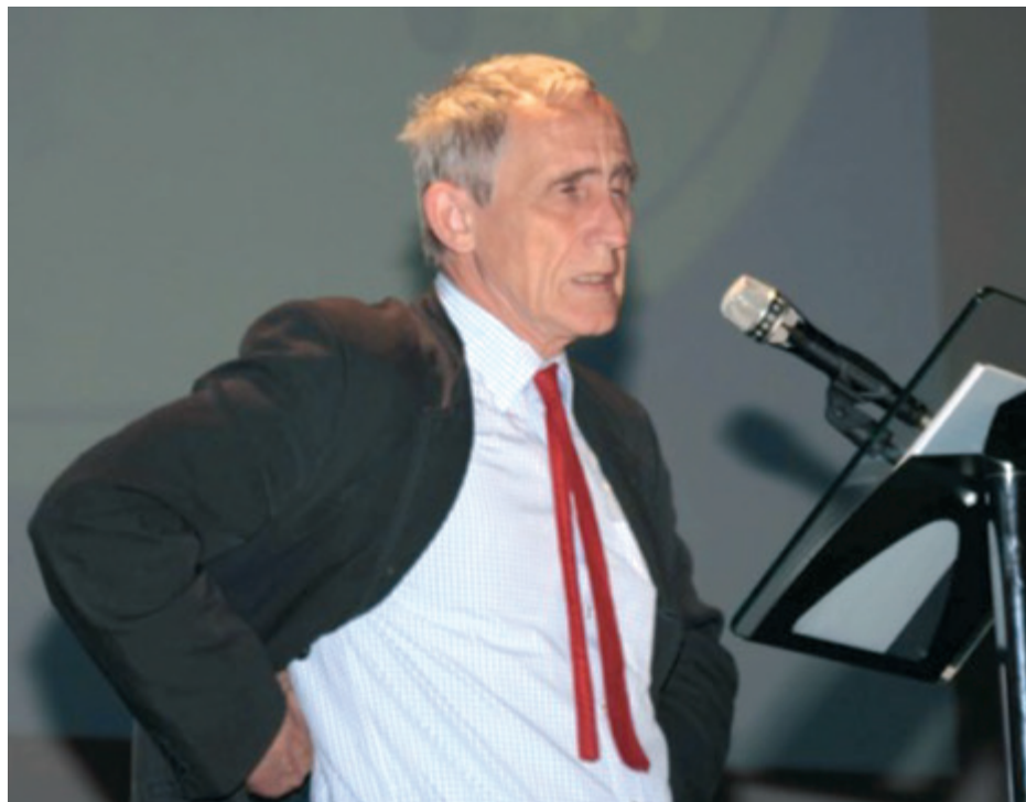
◀ Хорст Кехеле (1944–2020) ▶

Именно он научил меня внимательно слушать каждый доклад и включаться в его обсуждение! И я сама стала неистовой и остаюсь такой уже много лет. Хорст Кехеле ушел от нас в прошлом году.